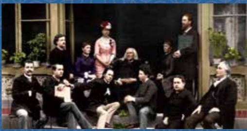
多くの優れた弟子に囲まれた晩年のリスト [1884年]