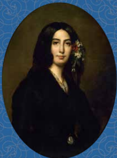
1838年にショパンと交際をはじめ、公私にわたり活動を支えたジョルジュ・サンド