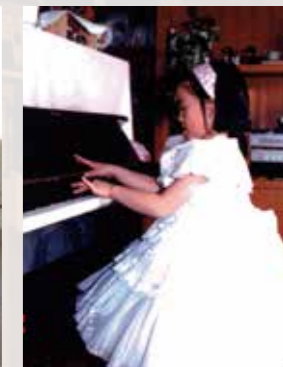
6歳の頃自宅にて。5歳からピアノを始め、12歳でオルガンと出会い魅了される。