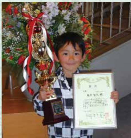
小学校2年生で挑戦したコンクールで「金賞」を獲得し笑顔の聖矢少年。