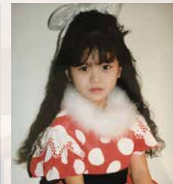
ピアノを始めた5歳頃。幼い頃からコンクールで入賞し、13歳の時には第27回バルマドール国際コンクールにて史上最年少で第1位を受賞した。