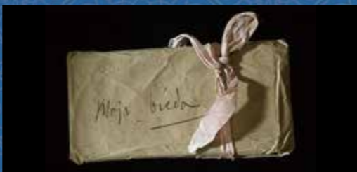
ショパンは婚約をしながらも別れた恋人マリア・ヴォジンスカとの手紙に「わが悲しみ」と記した