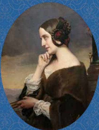
リストとマリー・ダグー伯爵夫人は3子をもうけたが結婚は認められなかった