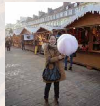
留学していたフランスの街カンにて。クリスマス時期には、留学していた友人を訪ね、色々な街のマーケットを楽しんだ。