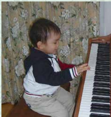
ピアノを弾き始めた3歳の頃、高校生までを愛知県で過ごした。