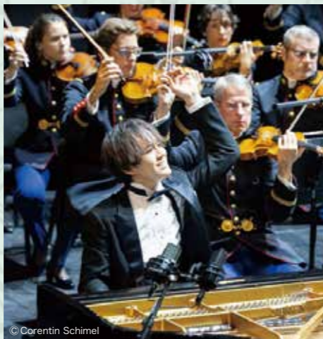
ロン＝ティボー国際音楽コンクールでは「納得の演奏」で優勝を果たした。