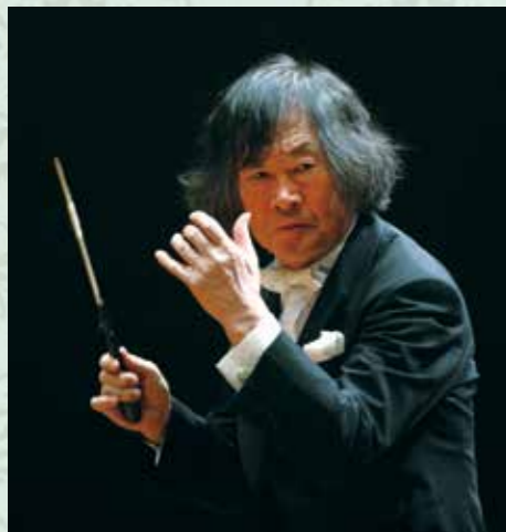
初共演のマエストロ小林研一郎。80歳を超えても世界から尊敬を集める。