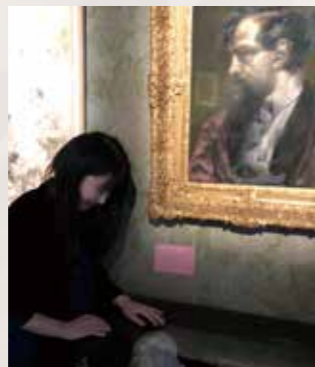
フランス留学時にドビュッシーの生家を訪れた。印象派の作曲家の中でも、ドビュッシーの作品には深い思い入れがある。