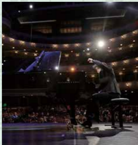
クライバーン国際コンクールではセミファイナルに残り世界の注目を集めた。