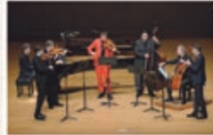
フィルハーモニクス ウィーン=ベルリン

〈アークホール〉 曲目/マーキュリー (フィルハー モニクス版): ドント・ストップ・ミー・ ナウ ベートーヴェン(コンツ編): スウィング・オン・ベートー ヴェン ほか