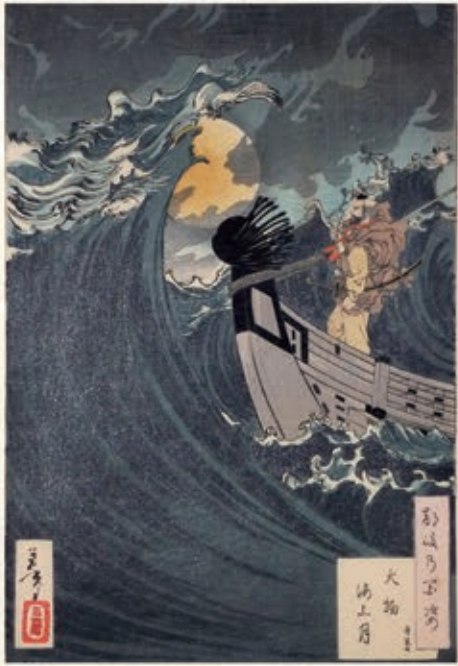
月岡芳年(1839年-1892年)による「大物海上月」 船の上で怨霊を退散させようとする弁慶。

物語の後半、船が沖合に出ると、にわかには風が出て波が高くなる。船を漕ぎ進めると、荒れ狂う波間から長刀を持った平知盛の怨霊が現れる。かつて源平合戦で義経に追い詰められ海に沈んだ知盛。その怨霊は義経と弁慶を海に引きずり込もうと襲いかかる。義経は刀を抜いて応戦するが、弁慶は数珠を手に経文によって悪霊を追い払おうとする。大海原での戦いはいかに・・・