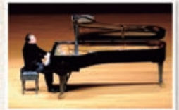
ファジル・サイ [ピアノ]

〈アークホール〉 曲目/ベートーヴェン: ピアノ・ソ ナタ第14番《月光》 ドビュッシー: 《ベルガマス ク組曲》 ほか