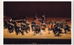
東京グランド・ソロイスト

〈アークホール〉 曲目/《オール・ピアンラ・プロ グラム》 リベルタンゴ、ブエノスアイレスの夏 ほか