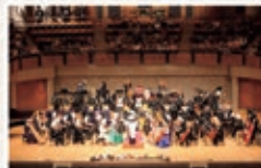
2022 ズーラシアンブラス

〈アークホール〉 出演/ズーラシアンフィルハーモニー管弦楽団 曲目/ジルバスターファンファーレ 動物紅白歌合戦2022 ほか