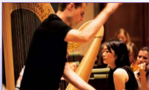
ミュンヘン国際コンクールで3位に入賞。パイエルン放送響と協演を果たした。