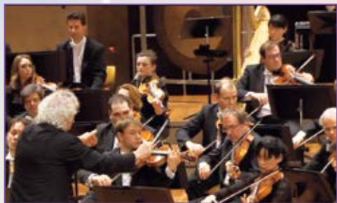
カラヤン・アカデミーではベルリン・フィルの団員としてラトルと共演！（右奥）