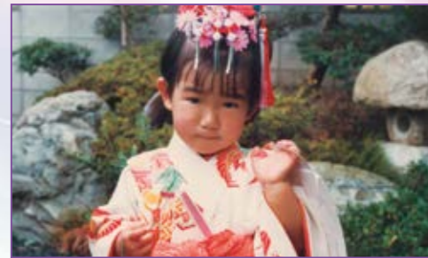
ピアノに夢中だった3歳の頃。「七五三」で祖父が撮ってくれた思い出の1枚。