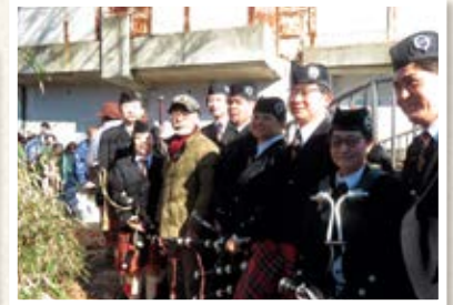
東京パイプバンド