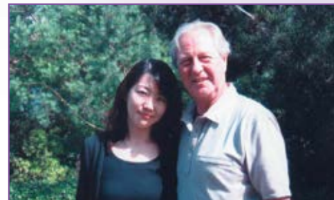
尊敬するマイゼン先生には、ミュンヘンのご自宅でもレッスンを受けることができた。