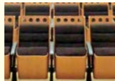
▲撤去前の座面と背もたれのクッション