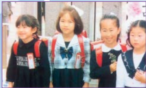
所沢出身です！中富小学校の入学式で（一番左）