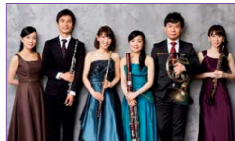
同世代の「東京六人組」はお互いに刺激し合う大切な仲間！